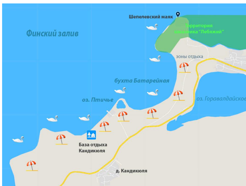
Карта-схема бухты Батарейная и окрестностей.

К тому же, бухта Батарейная остается одним из самых чистых участков побережья Финского залива, востребованных у отдыхающих. Сюда в летний период приезжают тысячи жителей Ленинградской области и Санкт-Петербурга.